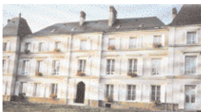
le centre de formation