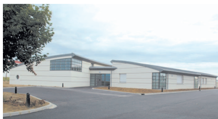
le centre de formation